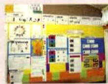
グループ編成表。自分のレベルは誰でも把握できる。

個人尊重社会のNZ。年齢主義ではなく年齢・習熟度優先なので複式学級(20~26名)が多い。クラス編成はReading(読書力)中心だが、科目毎で教室間移動が頻繁、一日中同じ教室の同じ席に座っているこどもは少ない。だから担任の役割は、授業統率力以上に、個人毎の学び工程把握力、同僚やTeacher Aide(補助教員)とのヨコ連携が求められる。