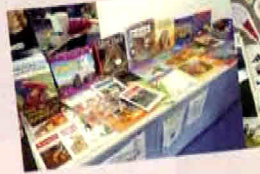
読書する本も Topic と運動する。

トピック学習社会のNZ。教科書のないNZ教育は百校百師百通りで、4学期毎に設定される全校テーマ(Topic)を主体とした学習方法が主流。平たく言うならば、毎日の午後の授業が「総合的な学習の時間」である。更にトピックは学年、教科、クラス、宿題とも横断的に運動するので“学びのリズム”を生み出しやすい。教科と実生活を組み合わせ、理論と実践(体験)を往来させる教授法はクロス・カリキュラー・アプローチ(CCA)と呼ばれ、先生たちの手腕が試される。